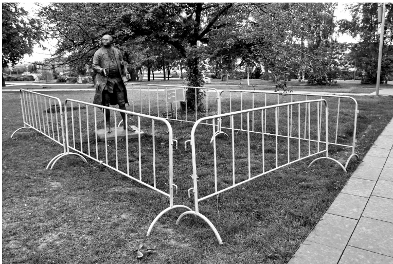
2. Скульптура, посвященная М. В. Ломоносову (Парк скульптур «Музеон») внутри хозяйственной ограды, 2016 / Sculpture dedicated to M.V. Lomonosov (Sculpture Park «Museon») inside the temporary fence, 2016.