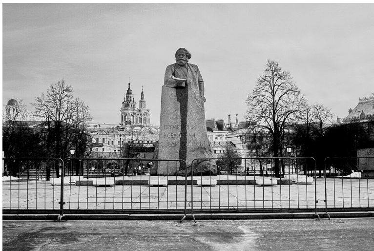
1. Пространство памятника К. Марксу (Площадь Революции) полностью перекрыто по периметру полицейскими заграждениями, 2016 / The space of the monument to Karl Marx (Revolution Square) is completely blocked by perimeter by police barriers, 2016.