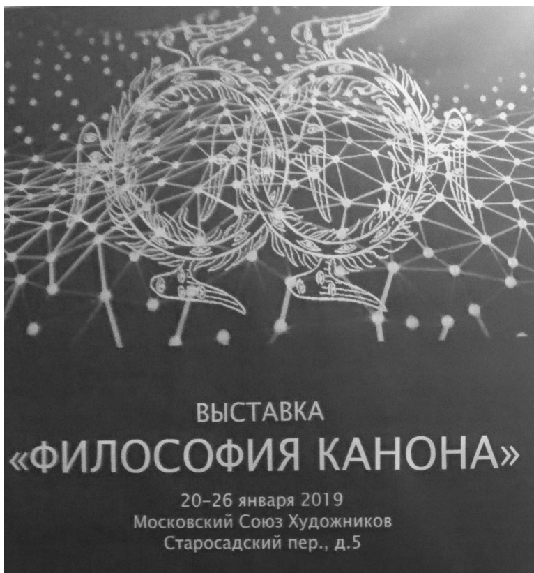
1. Афиша выставки / The poster of the exhibition.