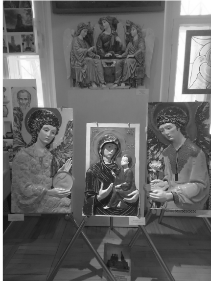
5. А. Кондрашев. Тихвинский образ Богоматери / А. Kondrashev. The Tikhvinsky Image of God's Mother