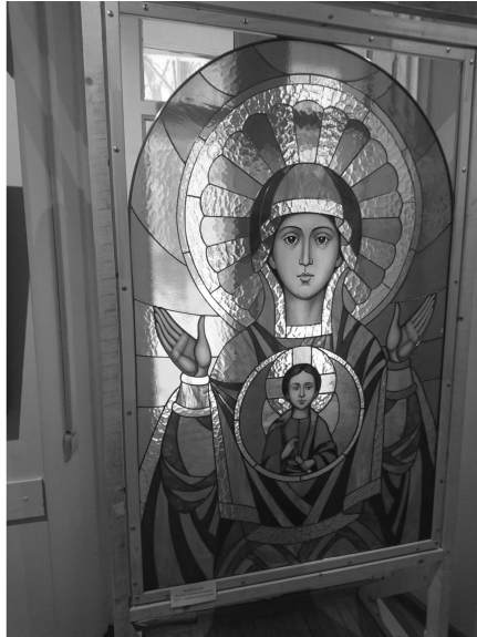
6. В. Михайлов. Храмовый витраж / V. Mikhailov. The Temple Stained Glass.