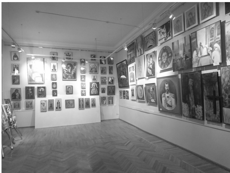
2. Общий вид одного из залов экспозиции / The general view of one of the exhibition halls