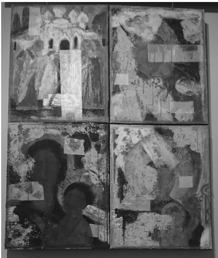
7. Е. Марьян. Из серии «Реставрация» / E. Maryan. From «The Restoration» series