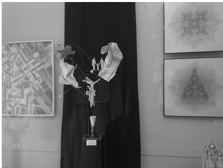
4. А. Бурганов. Распятие / A. Burganov. Crucifixion