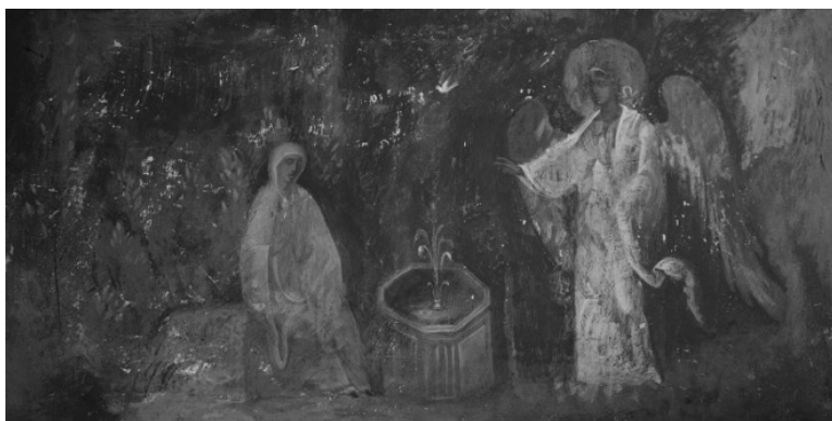
3. М. Цех. Благовещение / M. Zech. Annunciation